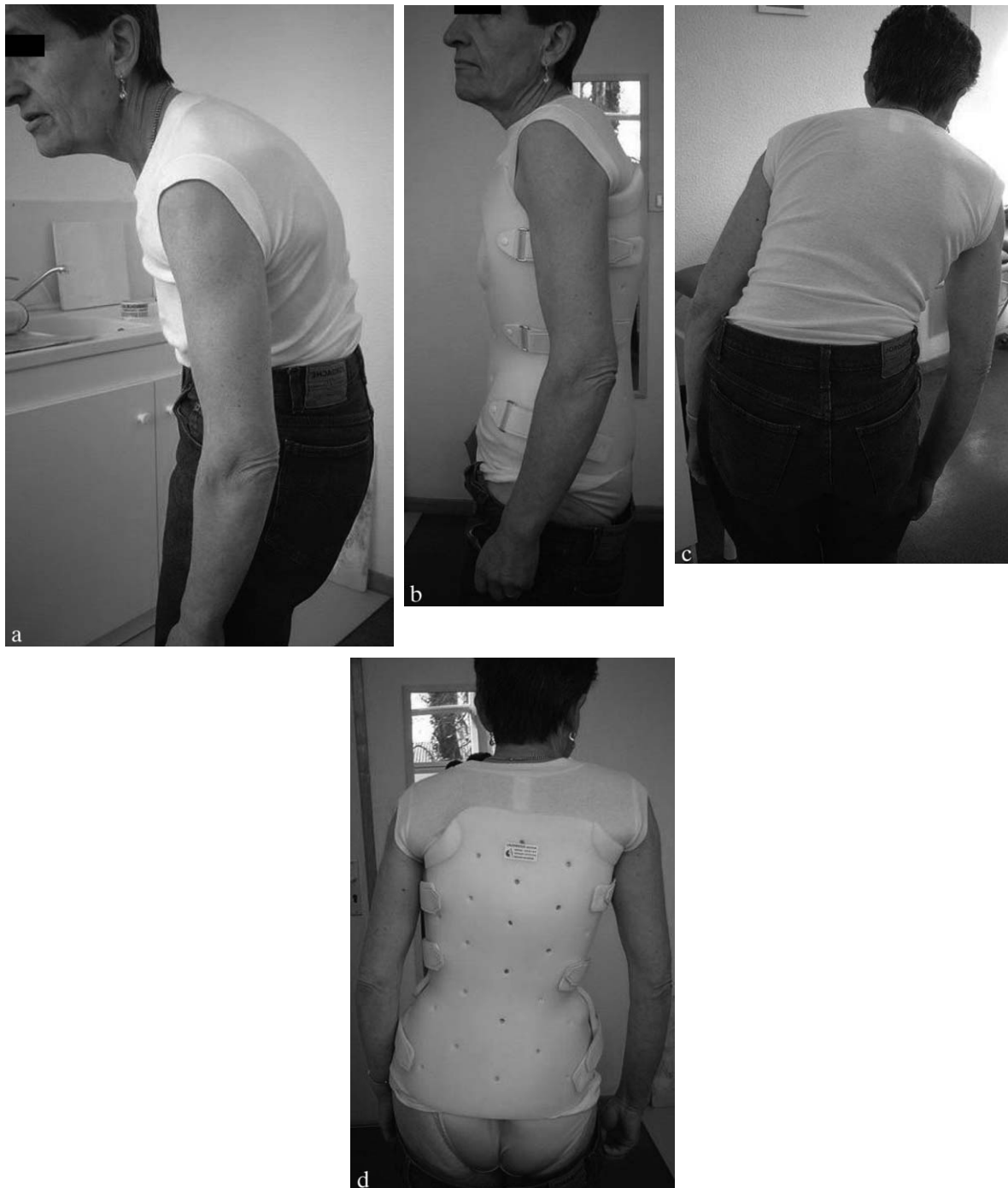
Fig. 2. Effet d'un corset lordosant. 2a et 2b : de profil ; 2c et 2d : de dos.

tion. Dans ce cas des infiltrations locales de corticoïde ainsi que le port d'un corset sont souvent proposés.